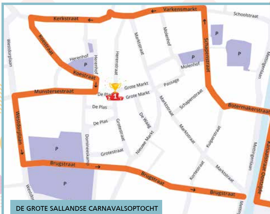
DE GROTE SALLANDSE CARNAVALSOPTOCHT ZONDAG 2 MAART 13.00 UUR START IN DE ALMLOSESTRAAT