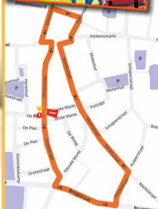
KINDEROPTOCHT ZATERDAG 1 MAART 14.00 UUR START VANAF DE GROTE MARKT / DE PLAS